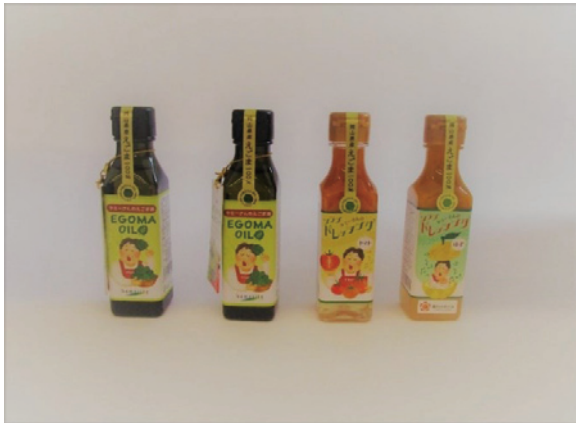
えごまドレッシング（ゆず・トマト）・えごま油650円