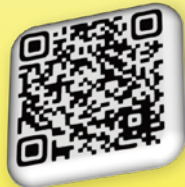
美咲町 子育て支援プラン