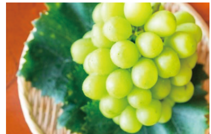
返礼品例：シャインマスカット

お申し込みの際は、町ホームページをご確認ください。なお、季節により収穫時期が限定されるものは収穫後の発送になりますのでご了承ください。