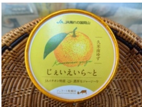
じえいえいら〜と 久米南ゆず 350円

その久米南ゆずを使用したジェラートがJA晴れの国岡山サンサンくめなん直売所（くめなん道の駅北側）などで好評販売中です。