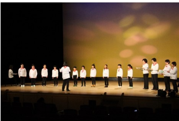
▲フェスティバルのようす（2021年2月）