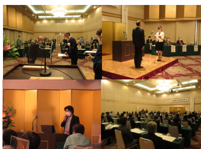
※上の写真は昨年のもので

従業員の方の永年の功労を称え ると共に、今後のモチベーション アップにつなげませんか。