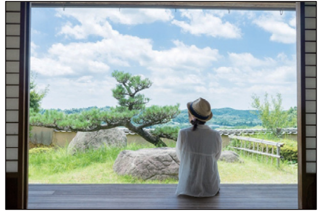
広い縁側でゆっくりとした時間を満喫