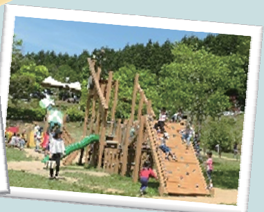
アスレチック広場

搾りたての新鮮な生乳を使ったまきばの森自慢のソフトクリームをぜひご賞味ください！