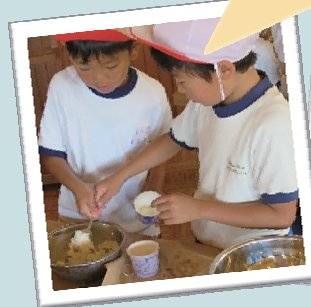
アイスクリーム作り体験