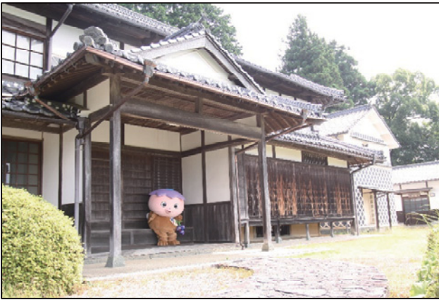
14の部屋や広い庭を使い放題