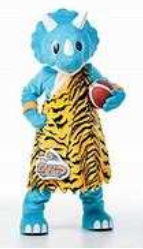
マスコットキャラクター「トライブ」