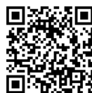
ホームページはこちら

ファジアーノ岡山ホームページ ( https://www.fagiano-okayama.com )