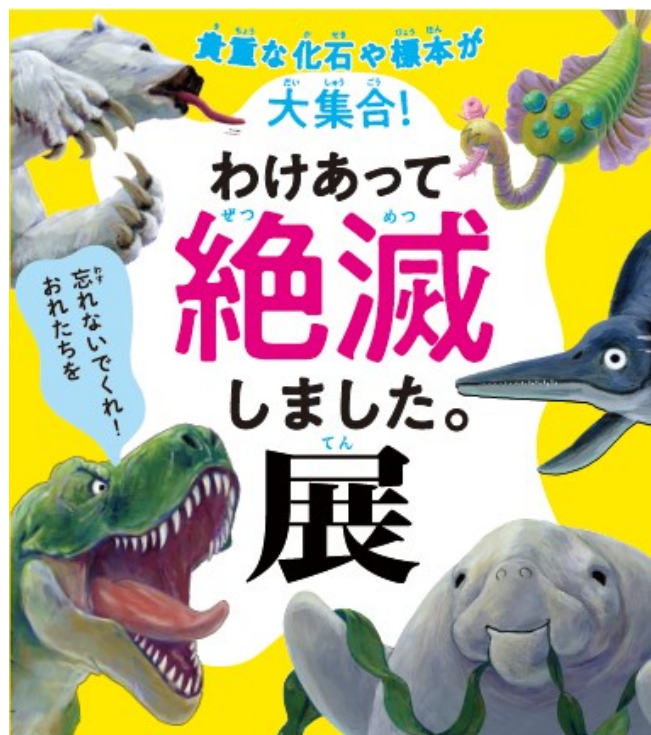
わけあって絶滅しました。