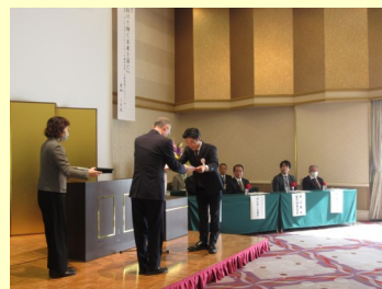
※写真は昨年のももの